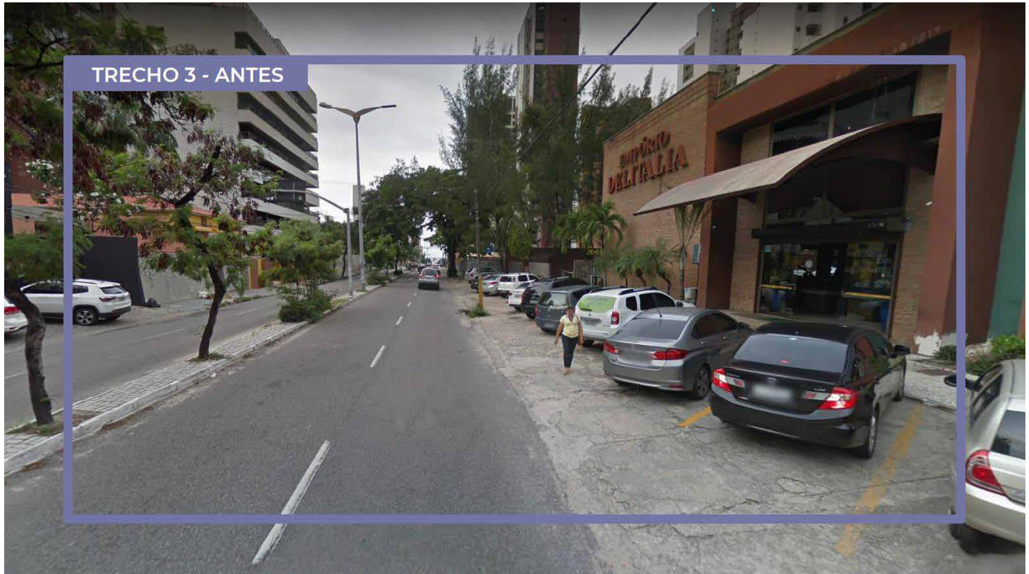
TRECHO 3 - ANTES